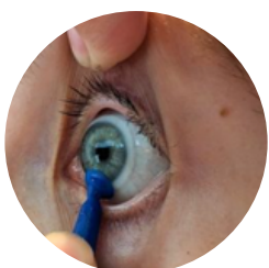
DI double inclined (vino)